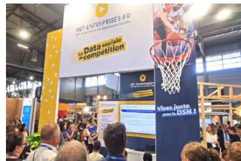
Stand de Net-entreprises au 78 e Congrès des Experts-Comptables

Que ce soit pour la DSN ou le prélèvement à la source, Net-entreprises a toujours mené ses projets en équipe. L'univers du sport est ainsi une belle façon d'incarner ses méthodes, ses recherches de performances et ses challenges quotidiens, d'autant plus dans un contexte de rendez-vous sportifs internationaux. Cette campagne est destinée aux utilisateurs, ainsi qu'à l'ensemble des acteurs qui gravitent autour de Net-entreprises, pour les mobiliser sur des objectifs de qualité et leur rappeler que la DSN est une aventure collective. Douze visuels ont été créés, représentant différents sports collectifs avec des accroches en lien avec les données sociales et la DSN. Ils sont diffusés sur le site net-entreprises.fr, sur les réseaux sociaux et lors d'événements tels que le Congrès des Experts-Comptables. Les Rencontres Extra se sont également inscrites dans ce thème. Des affiches sont disponibles sur demande, pour tous les membres dans les territoires. Cette campagne sera déployée jusqu'à fin 2024.