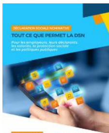
Dépliant « Tout ce que permet la DSN »