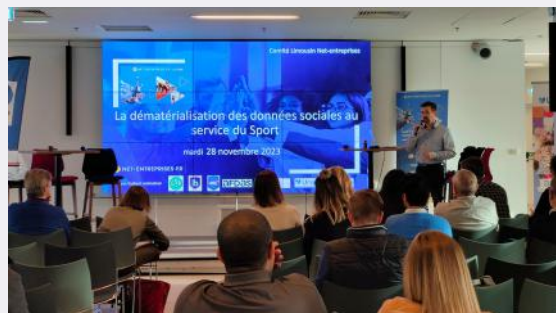
Comité Régional Limousin à Limoges