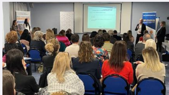
Comité Régional Normandie à Vire