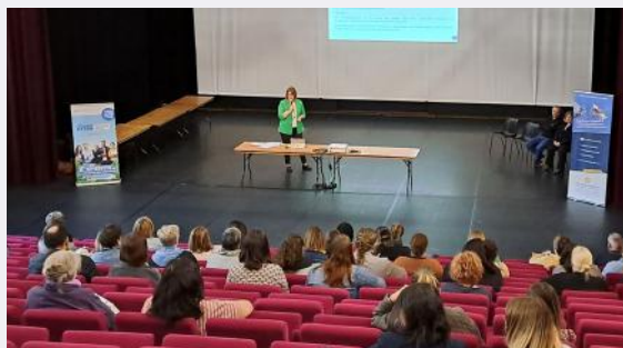
Comité Régional Normandie à Harfleur