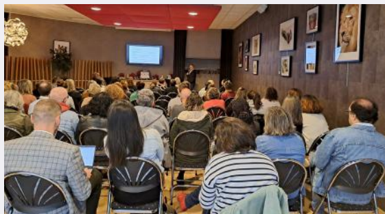
Comité Régional PACA Corse à Carros