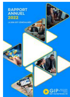
Le rapport annuel d'activité 2022