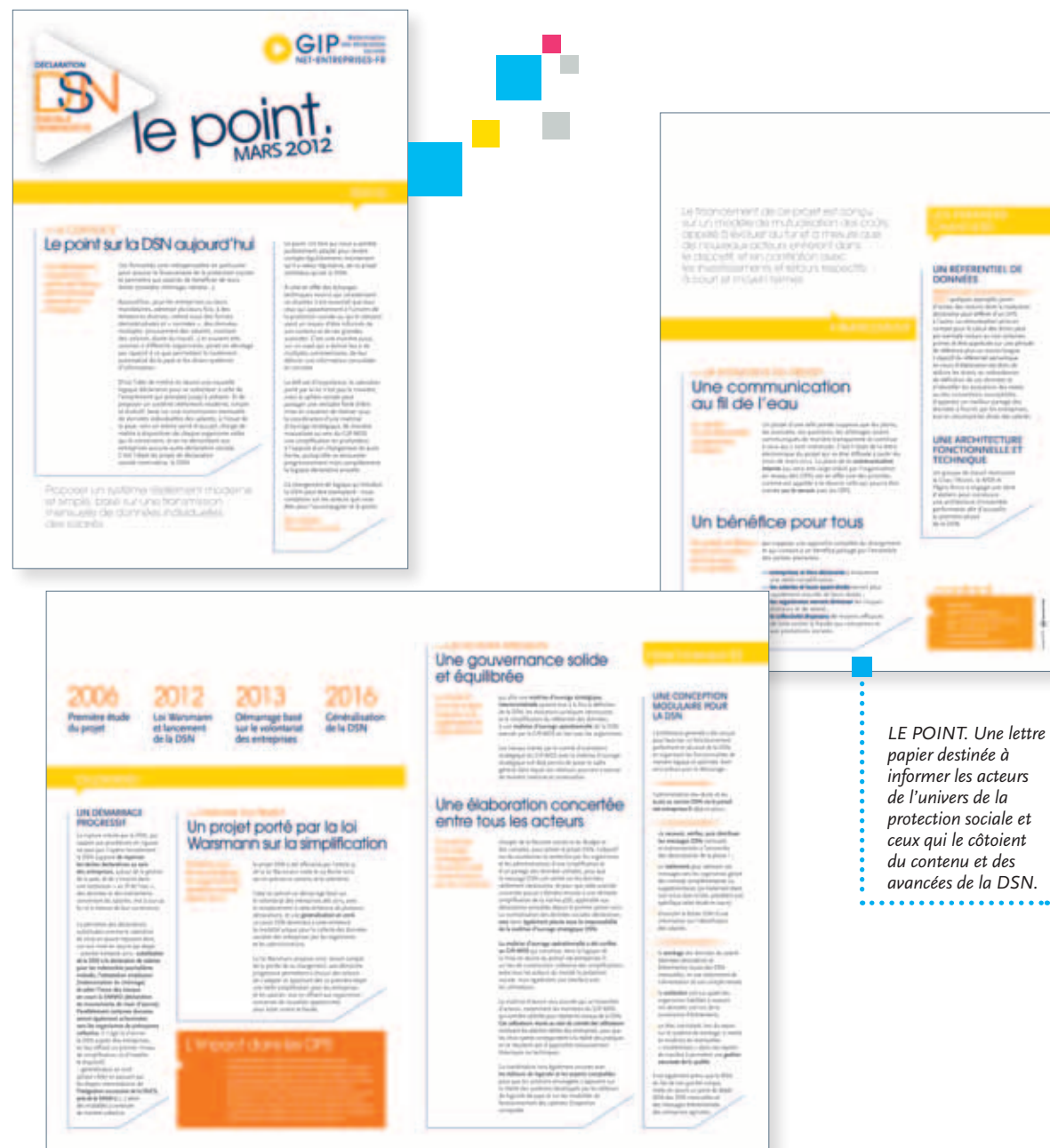
LE POINT. Une lettre papier destinée à informer les acteurs de l'univers de la protection sociale et ceux qui le côtoient du contenu et des avancées de la DSN.